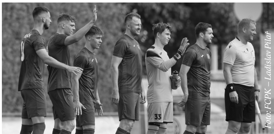
Kopaninští fotbalisté dobře reprezentovali na podzim ve 4. České fotbalové lize

Chcete být součástí FCPK? Hledáme posily do našeho marketingového týmu. Pište na jakub.ciganek@fcpk.cz