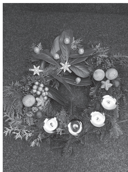
Tvoření adventních věnců v patře restaurace U Drahušky patří mezi nejpříjemnější akce pořádané Kopaninským spolkem