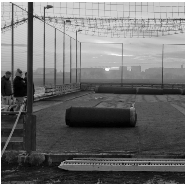
Kopaninští fotbalisté se můžou radovat z nového trávníku

Z celkem 154 přijatých žádostí vybrala hodnotící komise 93 projektů, mezi které rozdělila 24 milionů korun. Z městské části Přední Kopanina uspělo všech pět podaných žádostí. Finance v celkové hodnotě 2 850 000 Kč získaly iniciativy, které pokrývají široké spektrum zájmů našich občanů.