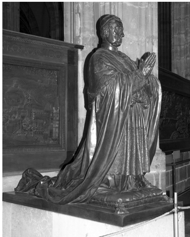
Arcibiskup Bedřich ze Schwarzenbergu má dnes sochu v katedrále svatého Víta, Václava a Vojtěcha