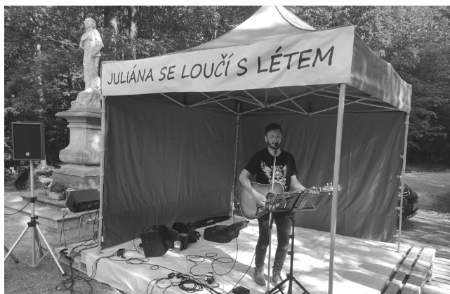
České a světové hity decentně podal All By Myself