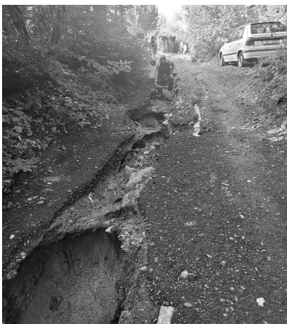
Na Skalce, neděle 18. srpna 2024...