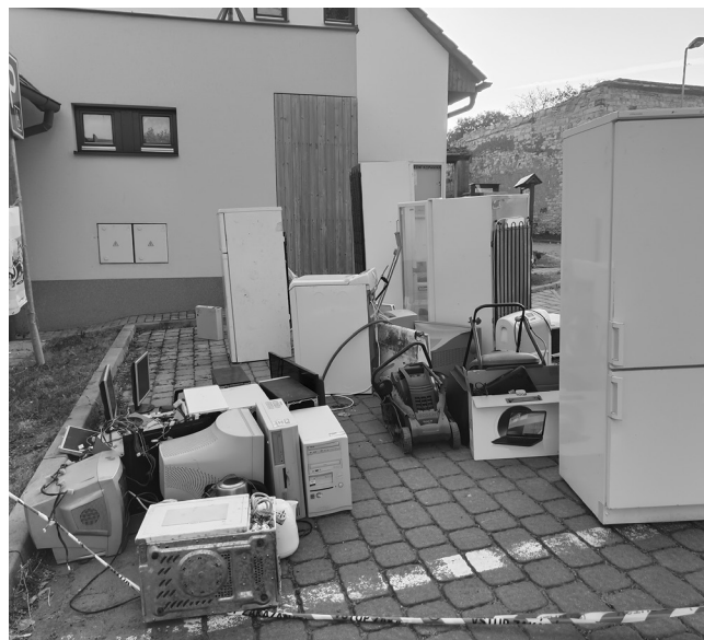
Sběrné místo bylo hned vedle radnice. A mnozí jistě byli rádi, že si ušetřili cestu na sběrný dvůr.