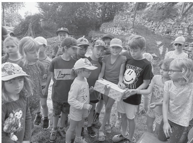
Že by ta krabice byla nějaký poklad?