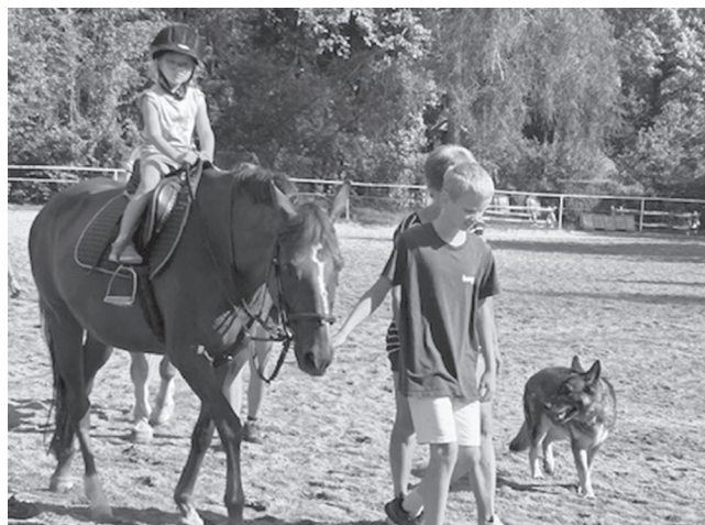
Koně jsou pravidelnou položkou táborového programu