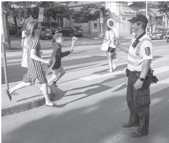
Vždy na začátku roku pomáhají dětem strážníci