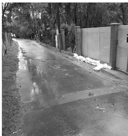
Preláta, sobota 13. září 2024...

Chmurné předpovědi se naštěstí nenaplnily. Ukázalo se, že poldr pod letištěm dokáže Kopaninský potok ukrotit spolehlivě. -jrt, pv-