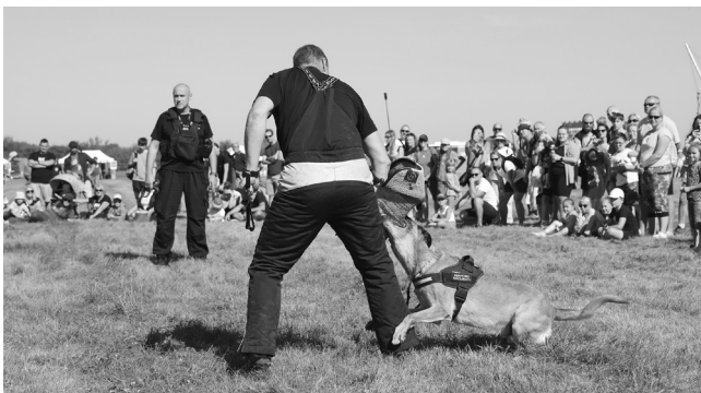
Svůj um předvedli zaměstnanci několika letištních složek