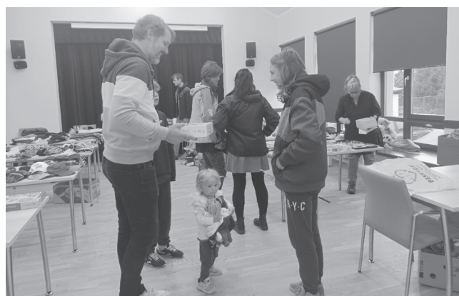
Jednoduchý princip: něco přineste, něco si odnese...