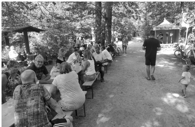
Odpolední posezení na rozcestí u Juliány bylo příjemné

První zářijovou sobotu proběhl druhý ročník akce Juliána se loučí s létem.