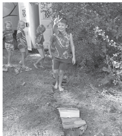
Jedna stezka pro dvě bosé nohy