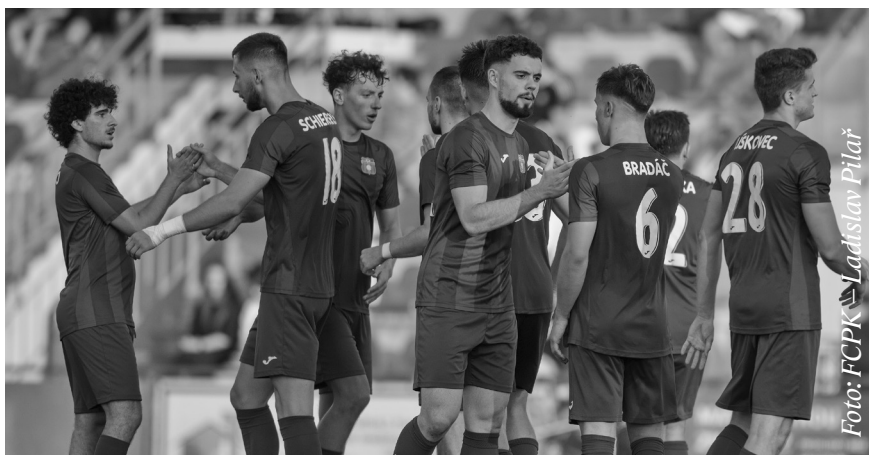
Fotbalisté ve čtvrtém kole 4. České fotbalové ligy zvítězili nad Českým Brodem 2:1