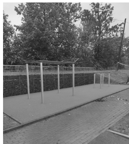
Obec má nový workout point

Dětské hřiště a workout Přední Kopanina. Tak zní oficiální název právě dokončeného projektu.