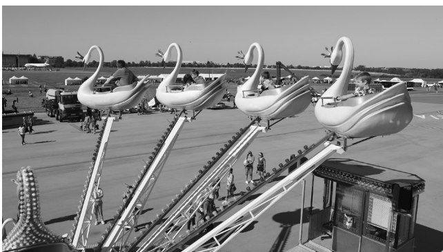
Na letišti přiletěly dokonce i labutě...

Původní vzletová a přistávací dráha 22 a její okolí se k radosti dětí proměnily v zábavní park plný atrakcí, hudebních vystoupení a soutěží. Návštěvníci měli možnost si detailně prohlédnout letištní a hasičskou techniku, prozkoumat letadlo či vrtulník nebo zhlédnout vystoupení psůvodů a sokolníků. Pro zájemce byl zároveň k dispozici informační stan s odborníky na oblast životního prostředí, monitoring hluku, nábor a rozvoje letiště, včetně výstavby paralelní dráhy.